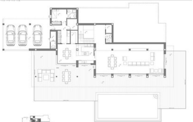
VILLA "LA CALA" PERSONALIZADO SUPERIOR