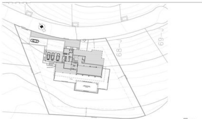
RESIDENCIAL JAZMINES LA CUMBRE DEL SOL